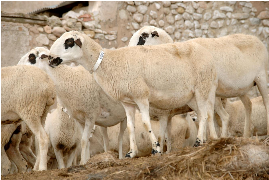
Imagen 1. Raza de ovejas montesina

De los resultados obtenidos se extrae que el 100% de las ganaderías muestreadas tiene base territorial en régimen de propiedad, con un tamaño medio de 612 ovejas reproductoras y cargas ganaderas medias de 1,3 ovejas por hectárea. En cuanto a la comercialización y gestión, todas venden los corderos tras el destete a través de canales tradicionales, por tanto, no realizan proceso de cebo, y en un 55% de ellas la ganadería supone la fuente principal de ingresos del titular.