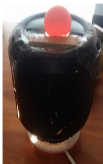
Imagen 1: Ovoscopio casero